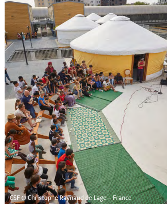
CSF © Christophe Raynaud de Lage - France

L'association a poursuivi en 2020 sa présence auprès de ces publics qui ont été très impactés par la crise sanitaire, sociale et économique. En 2021, de nouvelles collaborations verront le jour pour répondre à travers des interventions artistiques aux besoins psychosociaux des publics en grande précarité en France. CSF mettra son expertise, développée depuis 27 ans sur le terrain à l'international, au service des publics les plus fragilisés par la crise dans l'hexagone, notamment en Ile-de-France et en particulier dans les quartiers de la politique de la ville auprès des MIE.